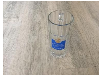
Anniversary Beer mug