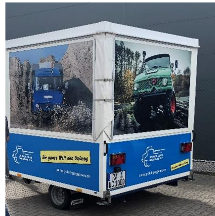
Anhänger nachher