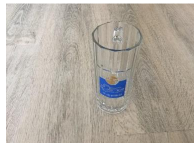
Anniversary beer mug