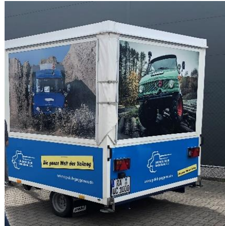
Trailer after