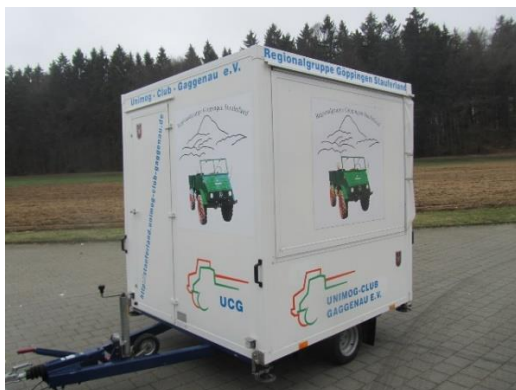
Trailer before

Already since last year we are again in possession of a trailer. This trailer was rebuilt from an accident vehicle many years ago by the regional group Göppingen/Stauferland. Since the trailer is no longer in use there, Wolfgang Küpper brought it back to the office. The idea was that all regional groups could use it if necessary. But before he travelled around the area, he underwent a beauty treatment. The old stickers were removed and a new one attached. Since then the pendant shines in new splendour with striking colours and great photos. The pendant had its first big appearance at the globetrotter meeting. There it was used as an information and sales stand for the office. So if you hold an event in the name of the Unimog Club, you can borrow the trailer at any time free of charge. Information on this is available at the office.