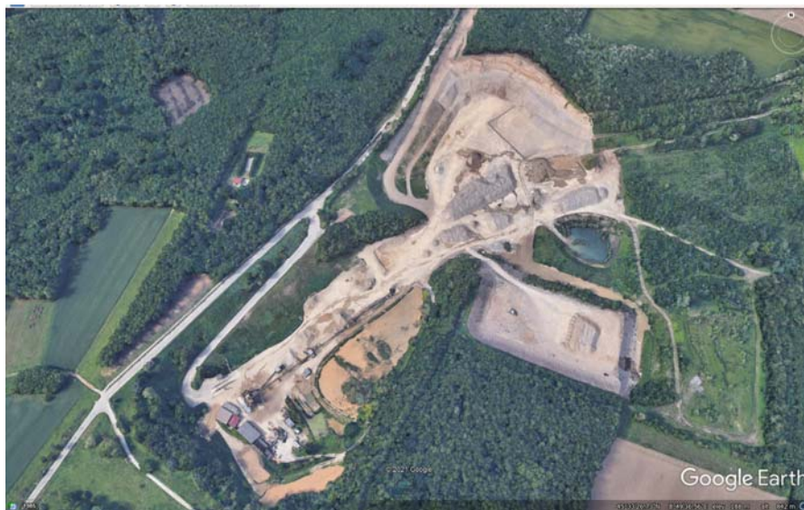
Bild 2 - Der Steinbruch von Buscate

Da Ausbildung und soziales Engagement zwei der Aufgaben unseres Clubs sind, haben wir beschlossen, den Zivilschutzgruppen die Möglichkeit zu bieten, an den Kursen teilzunehmen, mit dem Ziel, sie einige Bedingungen erleben zu lassen, die im Falle eines echten Notfalls auftreten können.