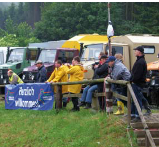
[10] Jahrestreffen 2009 in Aufenau