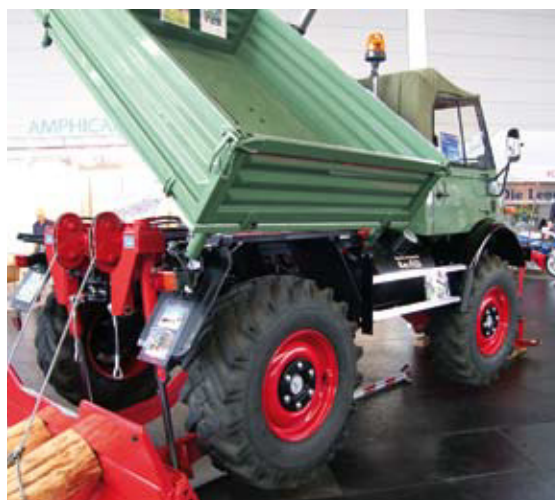
[20] Unimog inmitten edler Oldtimer-Pkw und Flugzeuge