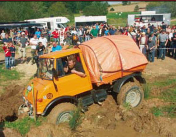
[13] Geländefahren im Grenzbereich